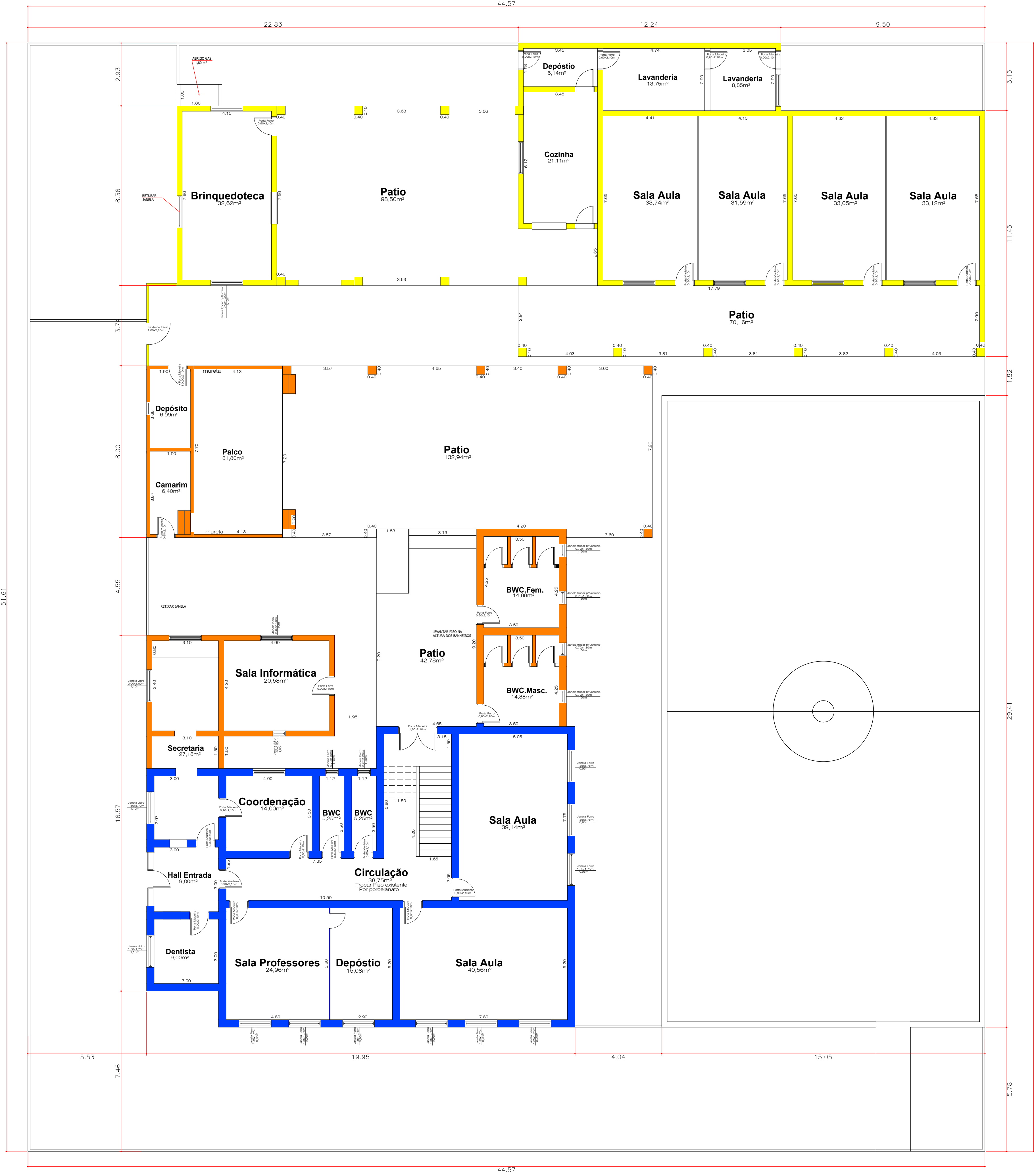
Planta Baixa esc: 1:100